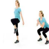
SQUATS MONTÉES GENOUX 30"