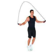
SAUTS PIEDS JOINTS 30"