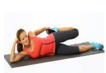
QUADRICEPS 15" CHAQUE

SI PAS DE CÔNE, POSER UNE BOUTEILLE D'EAU AU SOL SI PAS D'HALTÈRES, REMPLACER PAR BOUTEILLES D'EAU OU GOURDES REMPLIES TEMPS DE RÉCUPÉRATION ENTRE LES DIFFÉRENTES PARTIES : 1 MINUTE