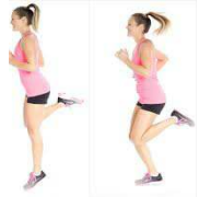
COURSE SUR PLACE 30"