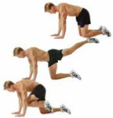
DONKEY KICK G 30"