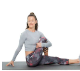
FESSIERS 15" CHAQUE