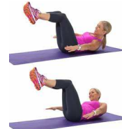
INCLINAISONS LATÉRALES 20"