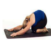
DOS ROND 15"