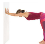
ÉPAULES - DOS 30"