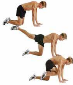
DONKEY KICK D 30"