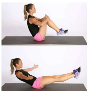
HUG CRUNCH 20"