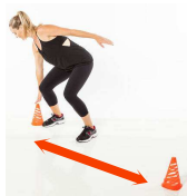
ALLERS / RETOURS 30"