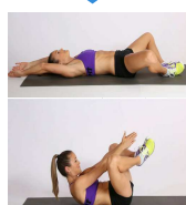
BUTTERFLY CRUNCH 20"