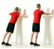
POMPES AU MUR 30"