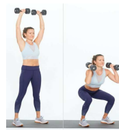
SQUATS + ÉPAULES 30"