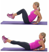
TENDU / Plié 20"